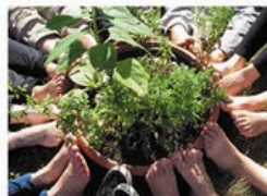
Bildung steht im Fokus BUNTE LEBENSWELTEN

Der Bildungsverein hat drei Schwerpunkte: Die Begabungsförderung, die sich vor allem an junge Erwachsene richtet, den Klimaschutz und ein Kulturprojekt mit Clowns. Man darf ausprobieren, mitmachen und viel dazulernen.