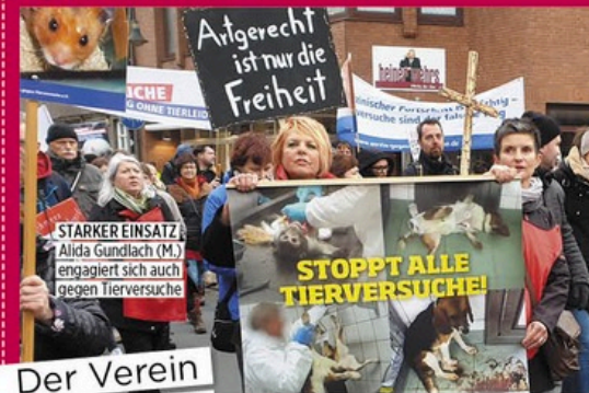
Der Verein „Tierwork“