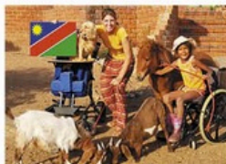
Pflege für kranke Kinder HUMAN DREAMS

Miteinander – füreinander. Wir bleiben so gespannt! Danke! Ihre FUNK UHR-Redaktion