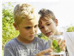
Rettung der Biotope LOKI SCHMIDT STIFTUNG

Unverzichtbare Überlebensinseln: Durch Spenden erwirbt und rettet die Stiftung bundesweit viele Biotope und gibt damit bedrohten Tieren und Pflanzen eine Zukunft. Kindern bietet sie wichtige Lernerlebnisse in der Natur.