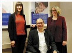
Mit Rat und Tat zur Stelle MUSKELSCHWUND-HILFE

Seit 35 Jahren unterstützt der Verein Menschen, die an Muskelschwund erkrankt sind. Er bietet individuelle Beratung, zeigt Therapiemöglichkeiten, vermittelt Fachärzte, sorgt für Schulbetreuung und macht vor allem Mut!