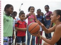
Für Natur und Menschen GESPA

Die Gesellschaft zur Förderung von Solidarität und Partnerschaft e. V. kämpft weltweit gegen Umweltzerstörung, Klimawandel und Armut. Vom Artenschutz- bis zum Basketball-Projekt mit armen Kindern ist vieles dabei.