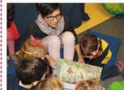
Kleine Zuhörer erfreuen LESEWELT ORTENAU

Kindern vorlesen, sie beim Lesen fördern und die Liebe zu Büchern vermitteln – 130 ehrenamtliche Mitarbeiter des Vereins sorgen in Kitas, Schulen und auf Veranstaltungen dafür. Es gibt sogar jugendliche Spielplatz-Vorleser.