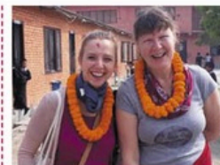
Hilfe für Leprakranke NEPRA

Leprakranke, sozial Benachteiligte, Behinderte und diskriminierte Menschen in Nepal erfahren Hilfe durch den Verein Nepra. In diesem Corona-Jahr stand an erster Stelle die Verteilung von Lebensmitteln an Arme und Kranke.